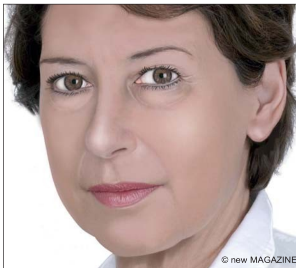
Figura 9. Blefaroplastica: aspetto pre-operatorio.

Il giorno dell’intervento è opportuno non eseguire il make-up del viso e dell’area perioculare e rimuovere