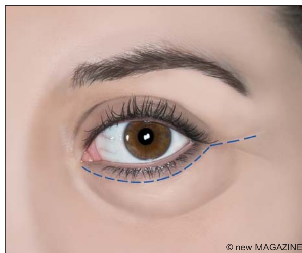
Figura 11. Blefaroplastica inferiore con incisione subciliare.

L'intervento classico alla palpebra superiore prevede un'incisione di forma e di aspetto variabile secondo le indicazioni, condotta in modo da far cadere la cicatrice nella piega naturale delle palpebre e renderla, di fatto, poco visibile quando il soggetto mantiene gli occhi aperti. L'incisione può estendersi lateralmente all'angolo esterno dell'occhio con direzione tale da confondersi con le piccole rughe di espressione presenti a questo livello. La cute in eccesso è asportata. Secondo i casi, può essere indicata la rimozione di una