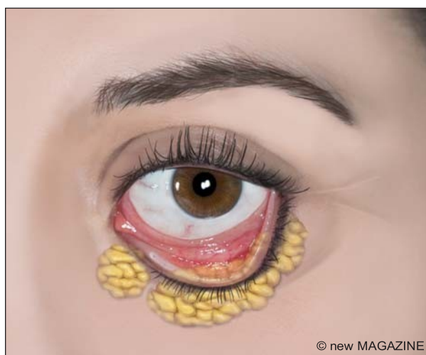
Figura 12. Blefaroplastica inferiore mediante accesso transcongiuntivale.

piccola striscia di muscolo orbicolare e la riduzione delle borse adipose. Dopo un'attenta emostasi si procede alla sutura con punti sottili e alla medicazione. L'intervento alla palpebra inferiore può essere condotto per via esterna o attraverso un'incisione transcongiuntivale. Nel primo caso (blefaroplastica per via esterna) è condotto attraverso un'incisione che decorre pochi millimetri sotto la linea delle ciglia e si prolunga di poco lateralmente all'angolo esterno dell'occhio. Le borse adipose, secondo le tecniche, possono essere ridotte (asportate) o riposizionate per correggere eventuali difetti a livello del solco lacrimale (occhiaie). Si procede quindi alla rimozione della cute, se in eccesso, all'emostasi e alla sutura. Nel secondo caso (blefaroplastica transcongiuntivale), l'incisione è eseguita solo attraverso la congiuntiva (faccia interna della palpebra inferiore). L'eventuale eccesso cutaneo è corretto con incisione cutanea subciliare o con tecniche alternative (laser assistite o peeling chimici).